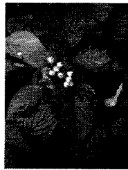
а) Свидина кроваво-красная

Выберите виды-интродуценты для Европейской части России.