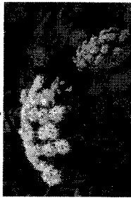
г) Дудник лесной