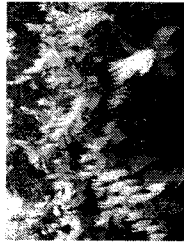
в) Ларича сахалинская