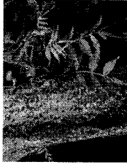
е) Орешник (лещина обыкновенная)

7. (2 балла) Выберите все правильные ответы.